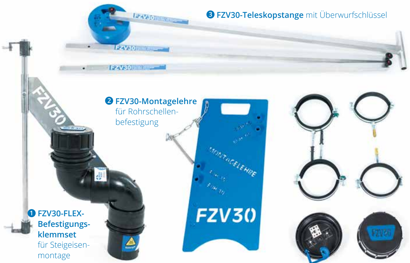
1 FZV30-FLEX-Befestigungsklemmset für Steigeisenmontage

Mit Hilfe des im Deckel befindlichen QR-Code kann die Schadnagerbekämpfung einfach und lückenlos in der easy-dok Software FZV30-Edition dokumentiert werden.